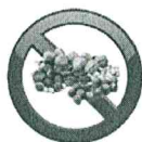
Fruit à coque