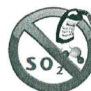
Sulfite Anhydre sulfu