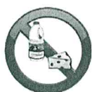
Lait - Laitage