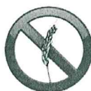
Blé Gluten - Protéine de Blé, Orge, Avoine, Seigle,